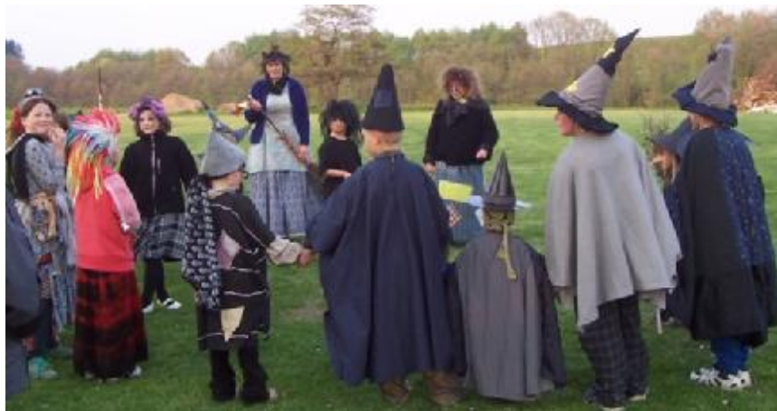
Pálení čarodějnic / Den matek